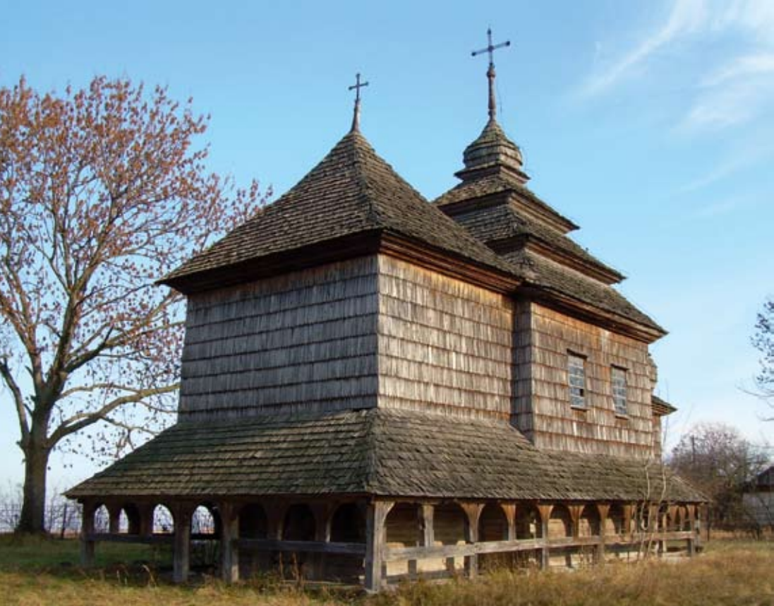
Храм архангела Михаїла (1697 р.) у селі Кути майже нікому не відомий, хоча знаходиться за кілька кілометрів від знаменитого Олеського замку

Неподалік від Олеська, під боком в іншого знаменитого замку, Підгорецького, донедавна існував ще один шедевр дерев'яної архітектури. Прекрасна Михайлівська церква (1720 р.) – суцільне «дерево», стояла на старовинному цвинтарі, на високій горі, з якої відкривався неповторний краєвид. Лише за кількост метрів від замку, включеного у туристичний маршрут «Золота підкова Львівщини», церква багато років стояла закрита й забута. Звістка про її загибель у вогні боляче вразила усіх, хто знається на українських пам'ятках.