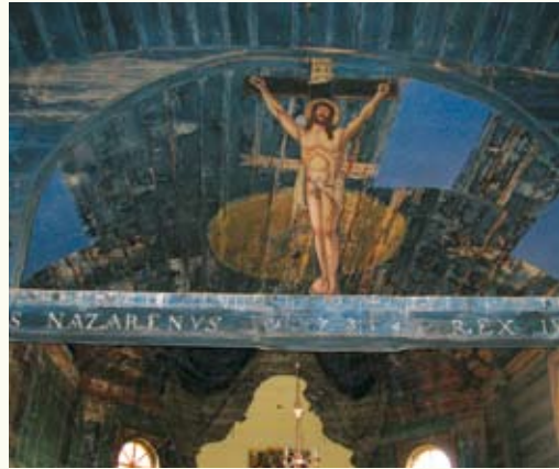
Інтер'єр костелу в селі Тадані. На балці під стелею – рик побудови «1734»

модної в той час на Галичині сецесії, поєднаної з елементами української народної архітектури. Будинок зазнав перебудов, тому важко повірити, що він був пам'яткою архітектури дерев'яної: мав зрубну конструкцію, стіни з брусів, в'язання кутів «у риб'ячий хвіст». Стіни були зовні і всередині покриті глиною і побілені. Нині вони вкриті цементною «шубою».