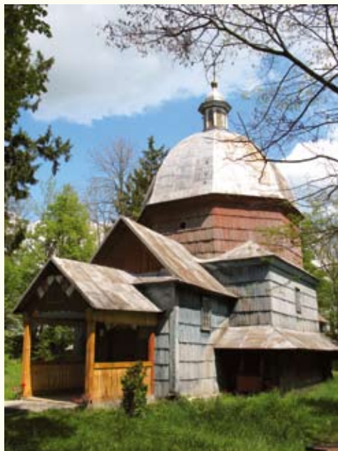
Церква св. Онуфрія (XVII ст.) розташована серед валів давньоруського городища

міста, Нового міста і четвертого міста Яблонова, а оточували його передмістя Довга Сторона, Ліпибоки, Німецький Бік, Воляни, Підзамче. Усі вони об'єднувалися в одне ціле системою гребель, мостів і каналів, якими, подібно до гондольєрів, їздили човнярі-«кумлажники», за що у XIX ст. Буськ отримав назву «Галицької Венеції». Згадується вона й у відомому путівнику Галичиною (втім, його автор Мечислав Орлович без зайвих сантиментів зазначає, що «місцевість ця болотиста і малярійна»). Береги каналів укріплювалися лозою та дерев'яними колодами, покладеними в зруб при мостах, самих мостів на 1866 рік налічувалося 68. Окрім мостів були й легендарні кладки по 400–500 метрів довжиною (куди там нашій переправі у Волиці-Деревлянській!), шириною у 2–3 дошки, на високих стовпах-опорах.