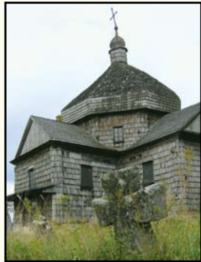
Михайлівська церква (1720 р.) також багато років простояла зачищеною, у забутті, за кількості метрів від іншого замку – в Підгірцях. Нещодавно вона згоріла – а може, була спалена вандалами...

маленький і гордий представник модерного стилю.