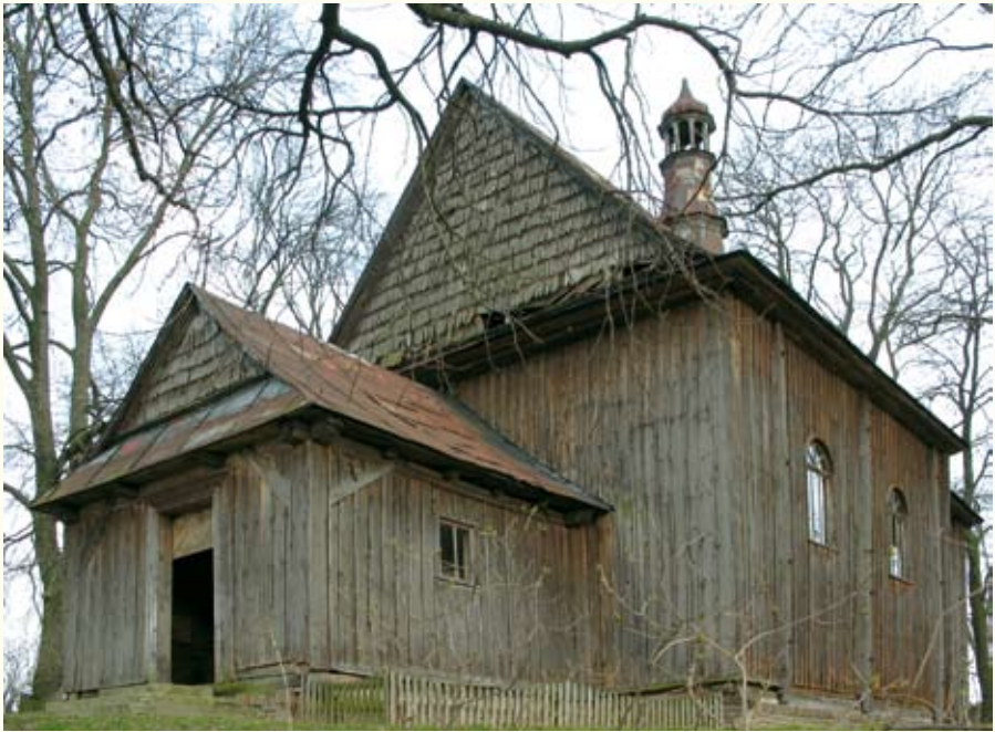
Село Тадані. Костел Відвідання Єлизавети Пресвятою Дівою Марією і св. Теклі (1734 р.)

дійшов до нас майже у первісному вигляді, більше того – зі стінописом. Повна назва костелу в Таданях звучить польською так: «Kościół p.w. Nawiedzenia Najświętszej Maryi Panny i św. Tekli», що в перекладі означає «Відвідання Єлизавети Пресвятою Дівою Марією і св. Теклі». У літературі його іноді називають скорочено Благовіщенським. За радянських часів храм використовували під колгоспну комору, а з 1992 року – це знову діючий римо-католицький костел. Утім, богослужіння в ньому проводять лише на великі свята – з Кам'янки-Бузької спеціально приїздить настоятель Успенського костелу, отець Владислав. Форми тридільного костелу, перекритого двохсхилими дахами, вигля-