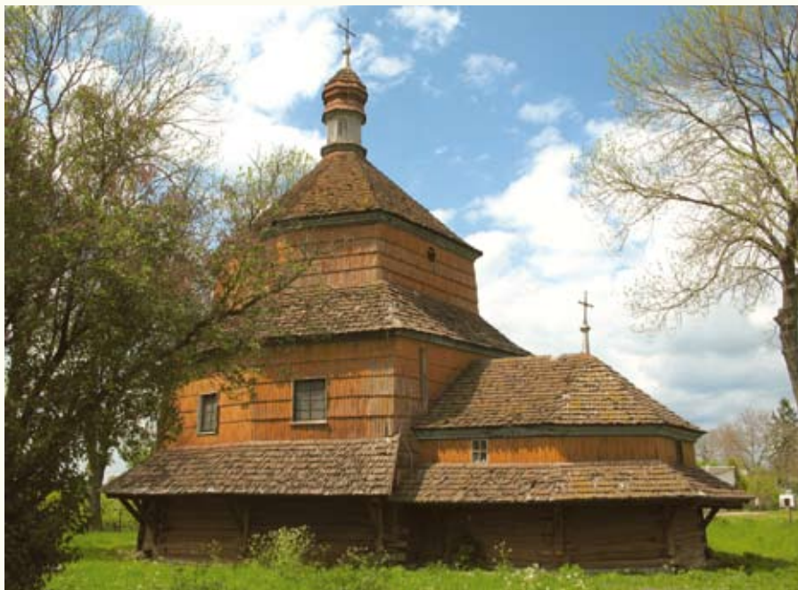
Силует центрального об'єму церкви св. Параскеви (1708 р.) нагадує діжечку

Церква й дзвіниця стоять на центральній вулиці села в оточенні високих дерев. Храм архангела Михаїла, збудований 1697 року теслюю Григорієм Сасовським, має особливість – ступінчастий пірамідальний дах, що походить від давнього шатрового перекриття і нині зустрічається дуже рідко. Ще одна яскрава деталь – споруджене 1865 року опасання у вигляді аркади-галереї, яке відновили у первісному вигляді під час реставрації 1974 року. Тоді ж споруду підняли на кам'яний фундамент.