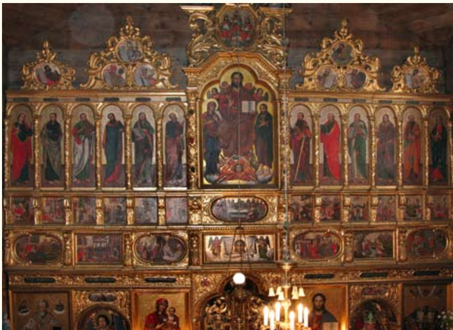
Іконостас Вознесенської церкви, що став хрестоматійним шедевром українського мистецтва, створили у 1680–1682 роках жовківські сницарі й малярі школи Івана Рутковича

Щоб користуватися нею, треба знати маленький секрет. Іти кладкою слід маленькими швидкими кроками, а то дасться взнаки підступне явище резонансу, й доведеться незграбно хапатися за дротяні перила. Інший кінець кладки знаходиться вже у Волиці-Деревлянській, і до церкви лишається пройти якусь сотню метрів направо сільською вулицею. Храм Вознесіння Господнього часто датують 1680 роком, однак згідно з написом на надпоріжнику західних дверей, пам'ятку слід датувати між 1651–1667 роками, тобто часом гетьманування Станіслава Потоцького, воеводи краківського. Відомо, що у 1662–1788 роках церква була монастирським храмом,