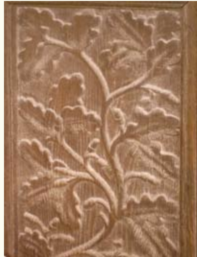
Різьба вхідних дверей

можна відвідати невеличке село МАХНІВЦІ (Золочівський р-н) . Тут знаходиться маленька гарна пам'ятка, яка завершує наш маршрут. Біля давньої, але зіпсованої поновленнями церкви св. Кузьми і Дем'яна (1697 р.) дивом збереглася в первісному вигляді чудова дзвіничка зі стрімким гонтовим дахом. Церква й дзвіниця були збудовані на місці попередніх, що згоріли під час татарського нападу. Щоб швидше звести храм, на це місце з найближчого лісу перенесли каплицю, до якої прибудували ще один зруб. Протягом наступних століть споруда виросла ще на один зруб та кілька бічних прибудов на додачу. Дзвіниця, зведена майстром з Поморян, належить до типу надбрамних дзвіниць (про їхнє походження докладніше написано в розділі по маршруту №5) і в разі небезпеки правила за сторожову вежу.