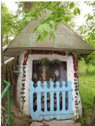
Каплиця, влаштована у стовбурі дуба, символізує печеру святого Онуфрія