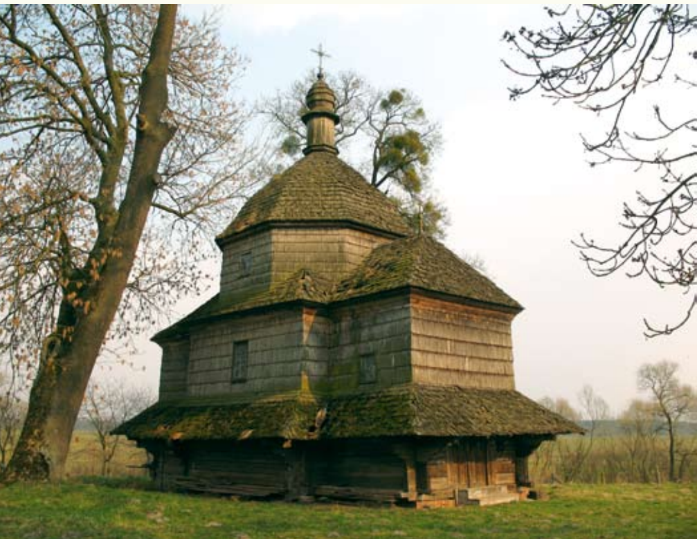
Церква св. Микити (1666 р.) у селі Дернів наче виринула з українських казок

дуже близькі до народного живопису на склі, що поширився з кінця XVIII ст. на території Українських Карпат. Це й не дивно – якщо дрогибицькі і потелицькі розписи виникли у міщанських та ремісничих колах, то у Вислобоках мешкали звичайні селяни. З меморіального віршованого панегірика польською мовою над південними дверима дізнаємося: у цьому невеличкому селі взагалі не було церкви, аж поки ним став володіти Казимир Правдич, і саме його стараннями і за допомогою єпископа Лева Шептицького у 1760-х роках постав новий храм.