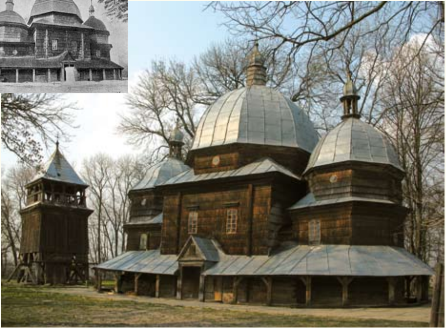
Храм св. Миколи (1667 р.) з дзвіницею (1762 р.) у Кам'янці-Бузькій