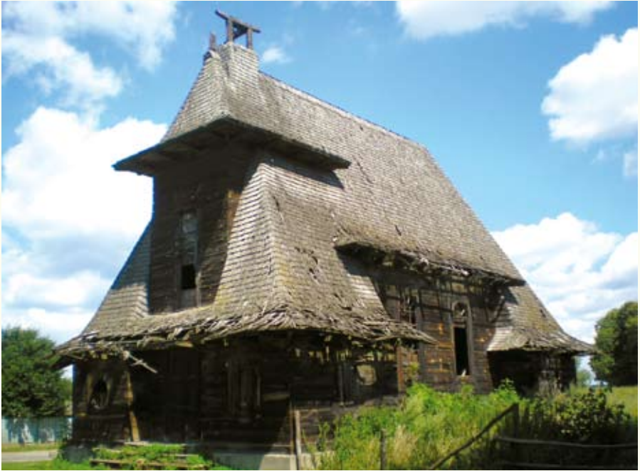
Каплиця для поляків у Язлівчику (1933 р.) – єдиний представник модернового стилю серед восьми збережених на Львівщині дерев'яних костеликів початку ХХ ст.