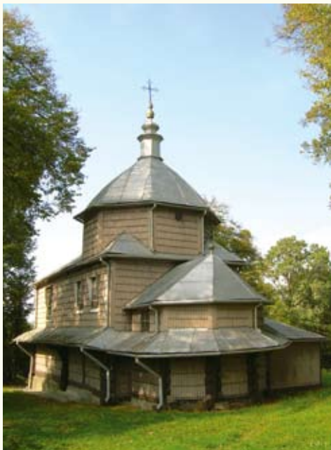
Храм Непорочного Зачаття Пречистої Діви Марії (1762 р.) у селі Вислобоки

Маршрут прямує зі Львова на північний схід, трасою на Кам'янку-Бузьку, і перший об'єкт знаходиться в селі ВИСЛОБОКИ (Кам'янсько-Бузький р-н) просто при дорозі. Навряд чи церква Непорочного Зачаття Пречистої Діви Марії зовнішнім вигля-