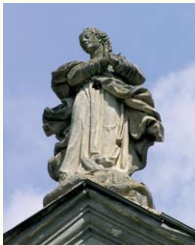
Скульптура на фасаді костьолу

цілком відповідають стилю пізнього бароко. Всередині панує стиль рококо. Пізніші прибудови не позбавили костьол загальних обрисів «калинови». Крипта під костьолом призначалася для поховань членів родини Калиновських. Вона вже давно розорена – але й до сьогодні тут є розкидані рештки людських кісток.