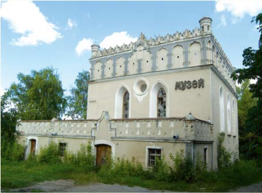
Гусятинська синагога (кін. XVI – поч. XVII ст.) на сучасній фотографії і на малюнку Г. Лукомського (поч. XX ст.)

доричний фриз з тригліфами й метопами, а головний вхід декоровано невеличким портиком іонічного ордера. Стрілчасті готичні вікна мали вітражі в кам'яних рамах. На південному фасаді вікна круглі, між двома могутніми контрфорсами. В інтер'єрі привертає увагу хрещате склепіння і ліпний картуш, обрамований «арматурою» з гармат, ядер, списів, шабель і прапорів, з гербом Калиновських «калинова». Нині костюл є діючим римокатолицьким храмом. Крім нього, до ансамблю бернардинського кляштору, скасованого 1784 року за декретом австрійського уряду, входить скромний корпус келій. Рештки оборонних мурів з наріжними вежами втрачено. Гарний для фотографування ракурс костюлу – над плесом озера – відкривається з боку траси на Пробіжну.