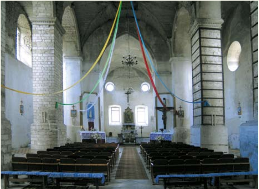
Інтер'єр гусятинського костьолу

1594 року син усятинського кушніра Северин Наливайко, який служив у надвірному війську князя Василя-Костянтина Острозького, дібрав ватагу вірних друзів козаків і очолив повстання проти магнатів, передусім – проти Калиновського, який вбив Севериногового батька. Жорстокою була помста: Наливайко доценту зруйнував Усятин. Повстання поширилося на значному просторі України й Білорусі, а її ватажок зажив слави національного героя, борця за волю й кращу долю. Згодом Наливайко брав участь у походах запорожців проти