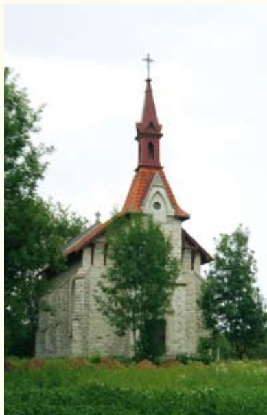
Костьолик у Бурдяківцях (1920–30-ті рр.)

Мурований замок бастионного типу розбудував у другій половині XVI ст. воевода сандомирський Станіслав Лянцкоронський замість попереднього, знищеного волохами. Твердиню розташували на північно-східній околиці містечка на крутому скелястому березі (звідси й назва – Скала) між струмком Чорнушка і Збручем. Замок був захищений скелями та рікою з трьох боків і лише з півдня був доступним. Щоб захистити вразливий бік, прокопали глибокий рів, звели кам'яні мури і округлу порохову вежу. З південної сторони