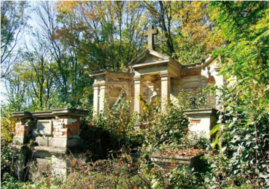
Родинний гробовець Пайгертів, власників Сидорова від поч. XIX ст. до 1939 р.

кав його син Адам Пайгерт (1829–1872), теж поет, перекладач творів Шекспіра. Останнім власником Сидорова, до вересня 1939 року, був онук Адама – Юзеф Каласантій Пайгерт-молодший (1891–1962). До маєтку Пайгертів вела брукована дорога – і тепер уважний мандрівник може відшукати на полі поблизу ферм давній мурований міст через пересохлий ставок. Поруч на полі видно входи в пивниці та підземелля – все, що залишилося від господарських приміщень колишніх поміщиків.