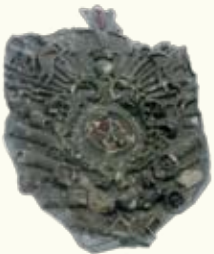
Герб «калинова» в інтер'єрі костьолу

На початку XVII ст. воєвода чернігівський, польний гетьман коронний Марцін Калиновський власним коштом розбудував Усятин. Отак на правому березі Збруча вирости прямокутний у плані замок з чотирма наріжними вежами, костьол, церква, синагога і ратуша з кранницями.